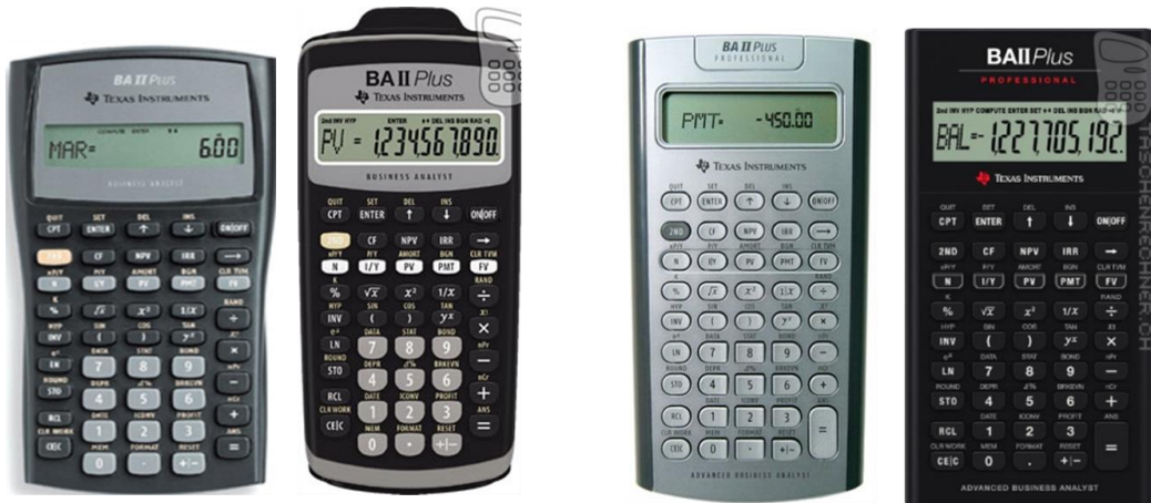
BA II Plus