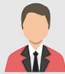
IC complex 2