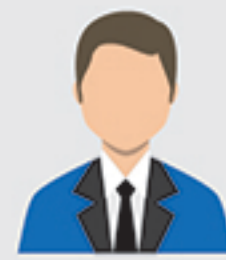
IC complex 3