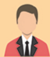
ผู้แนะนำการลงทุน ตราสารซับซ้อนประเภท 2 (IC complex 2)