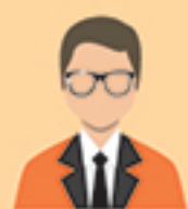
ผู้แนะนำการลงทุน ตราสารซับซ้อนประเภท 1 (IC complex 1)