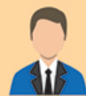
ผู้แนะนำการลงทุน ตราสารซับซ้อนประเภท 3 (IC complex 3)