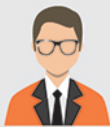
IC complex 1